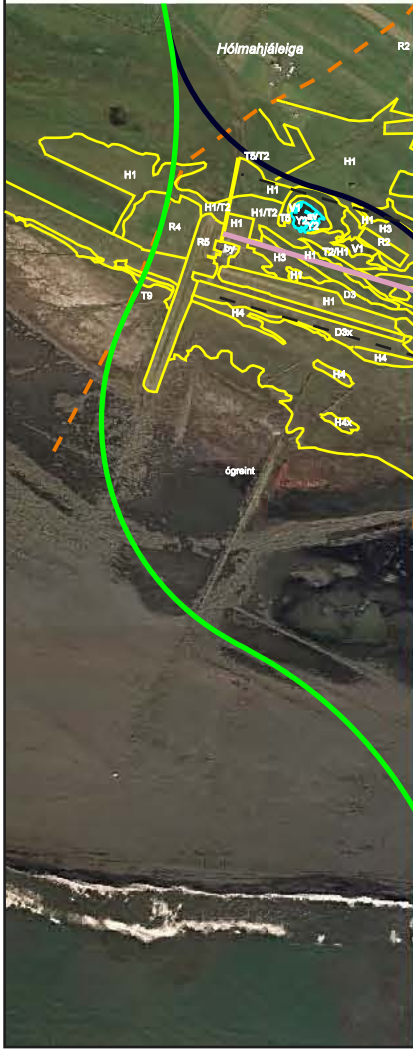
Kort 17. Gróðurfar, yfirlitskort